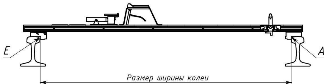
Рисунок В.1 – Схема измерения ширины колеи